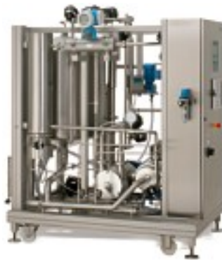
PharmaCIP PCA 2-5

Ob als eigenständiges Reinigungsmodul oder integriert in eine übergeordnete Prozesssteuerung, ob automatische Reinigungsabläufe oder frei wählbare Reinigungsprogramme – Westfalia Separator Engineering liefert Ihnen optimal abgestimmte CIP-Einheiten mit allen erforderlichen Qualifizierungen, Prüfungen und CE-gerechter Dokumentation.